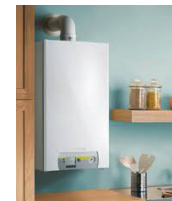
Chauffe-bain ou chaudière à gaz raccordé

Ils doivent être entretenus par des professionnels.