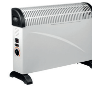
Chauffage d'appoint mobile électrique