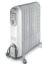
Radiateur d'appoint à bain d'huile

Ils ne génèrent pas de monoxyde de carbone. Veillez à leur bon état de marche afin d'éviter des courts circuits, cause fréquente d'incendie.