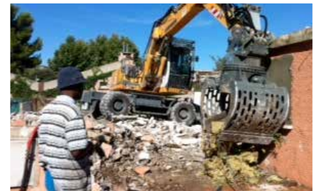
Les premières démolitions à la Pinède

Les travaux de démolition des 7 villas du hameau du Rocher vont débuter mi novembre, ils dureront 1,5 mois. Tout est mis en œuvre pour réduire les nuisances liées à ce chantier :