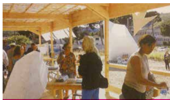
« Bar du rond point » installé dans le cadre de Marseille 2013.

C'EST À NOUS DE NE PAS OUBLIER LE LONG TERME